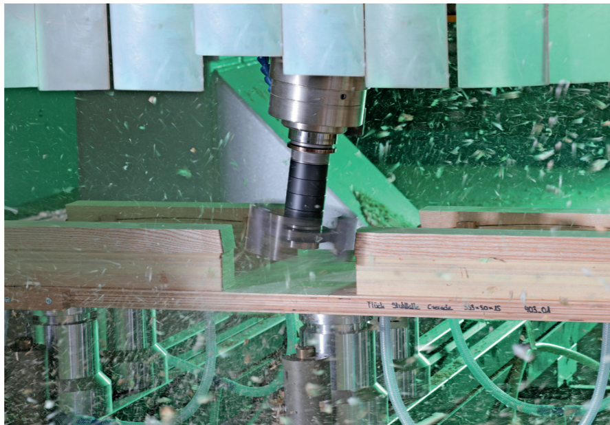
Mit Hilfe der Lasertechnologie können Flächen unterschiedlichster Grösse bearbeitet werden.