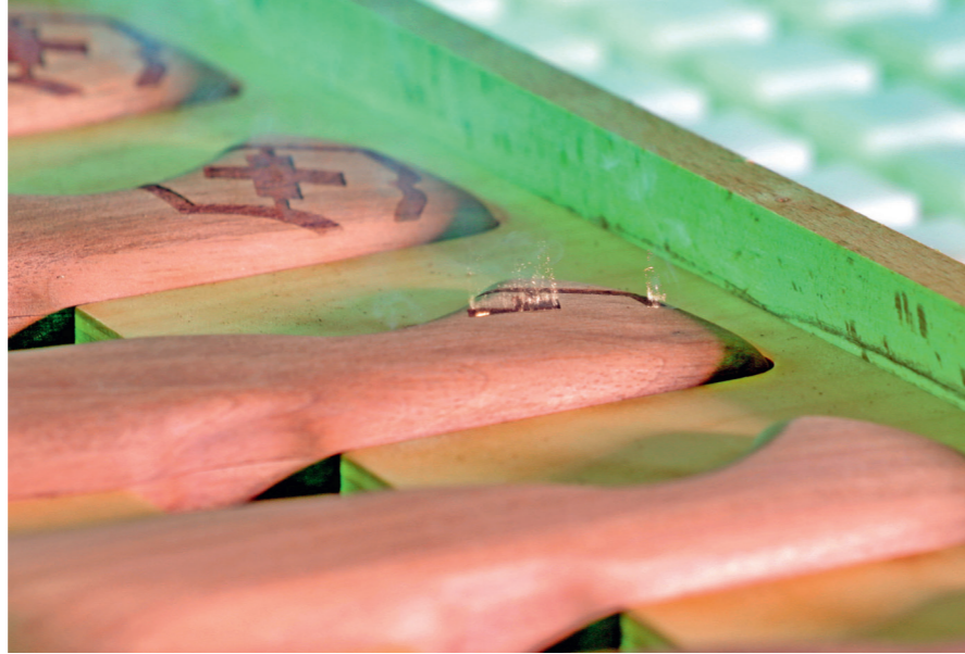
Die Möbelfabrik Muotathal setzte als einer der ersten Betriebe der Schweiz auf die moderne Lasertechnologie.

Der Verein InfraWatt setzt sich seit 2010 für die Energieproduktion und Energieeffizienz im Bereich Abwasser, Abfall, Abwärme und Trinkwasser ein und unterstützt Betreiber von Infrastrukturanlagen bei der Ermittlung und Realisierung von Energiepotenzialen. Zudem hat der Verein ein Mandat von «EnergieSchweiz» für den Bereich Energie in Infrastrukturanlagen. InfraWatt erteilt Auskünfte zum Förderprogramm und führt kostenlose Vorabklärungen durch. Weitere Informationen: www.infrawatt.ch